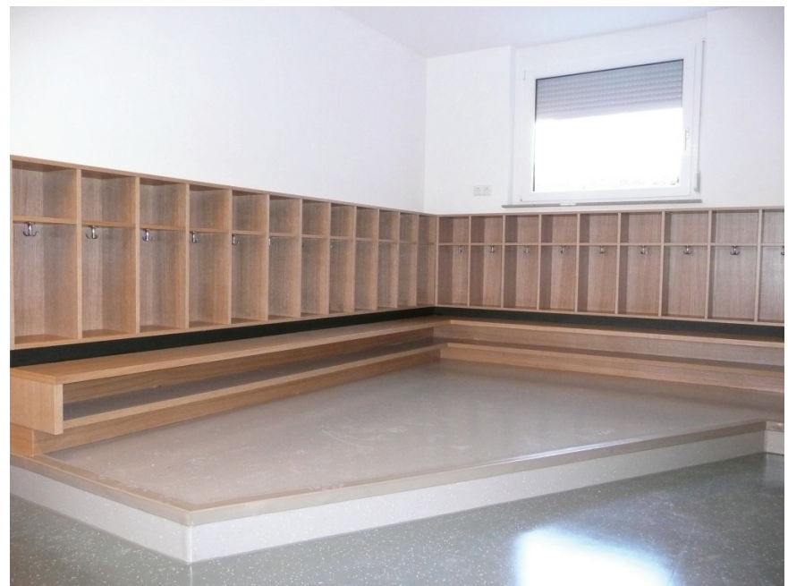
Abb. 2: Garderoben, die gruppiert sind und sich deutlich von der Verkehrsfläche, wie hier durch ein Podest abheben, führen zu einem Raum im Raum. Für die Kinder entsteht eine klare Orientierung, was hier zu geschehen hat. Die Fachkraft kann die Gruppe der anziehenden Kinder in der räumlichen Zonierung einfacher begleiten.

Als zentrales Ergebnis zu der Gestaltung des Übergangs lässt sich festhalten