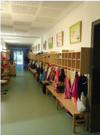
Abb. 1: Lange, schlauchartige Garderoben in langen Gangbereichen angeordnet, eng gepackt, alle gleich hoch und unzureichend für die Kinder gegliedert erschweren den Alltag – bestimmen jedoch in den meisten Kitas den Alltag

sche Fachkraft braucht dabei zunächst ein recht umfassendes Know-how sowohl zur Bewegungs- und Berührungs- als auch zur sprachlichen Interaktion.