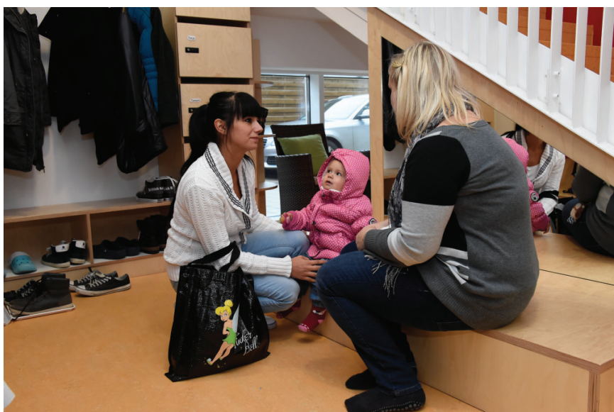
Abb. 3: Der Garderobenraum als Raum des »Tür-Angel-Austausches« zwischen Eltern, Fachkraft und Kind

ten: Es braucht eine bewusste Planung und anschließende Reflexion , um die Faktoren wie Kindergruppe, Personalverfügbarkeit, Raum, Zeitfenster, Tagesverfassungen, vorausgehende und anschließende Aktivitäten zu berücksichtigen.