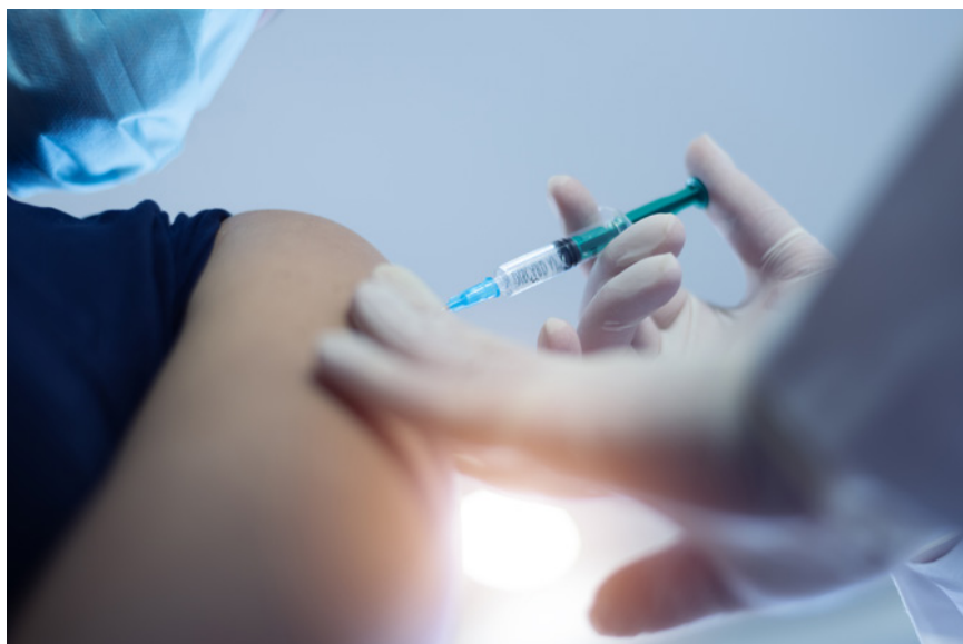
Abb. 1: Übliche leichte Impfreaktionen stellen regelmäßig keine Kontraindikationen dar.

Aus verfassungsrechtlichen Erwägungen lässt der Gesetzgeber aber auch ein ärztliches Zeugnis darüber ausreichen, dass die betroffene Person aufgrund einer medizinischen Kontraindikation nicht geimpft werden kann (§ 20 Abs. 9 S. 1 Nr. 2 IfSG). Sofern Schutzimpfungen